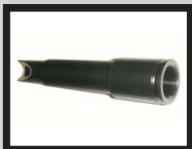
Einwurfrohr für automatische Bolzenzuführung