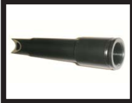
Einwurfrohr für manuelle Bolzenzuführung