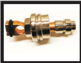
Adapter Automatikschweißkopf für Standardbolzenhalter