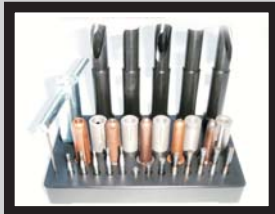
Sortimentplatte komplett für automatische Bolzenzuführung Ø 3-8mm Länge 6-30mm