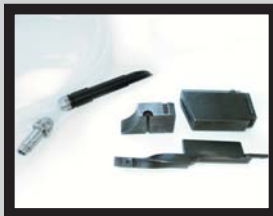
Umrüstsatz bestehend aus Bolzen Zuführrinne Schieber