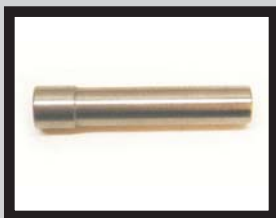
Ladestößel / zylindrisch für Ø5-Ø8