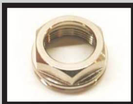
Spannmutter für Kolben vorne