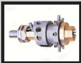
Kolben mitte mit Mitnehmer und Hubverstellung