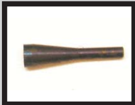
Ladestößel / konisch für Ø3, Ø4